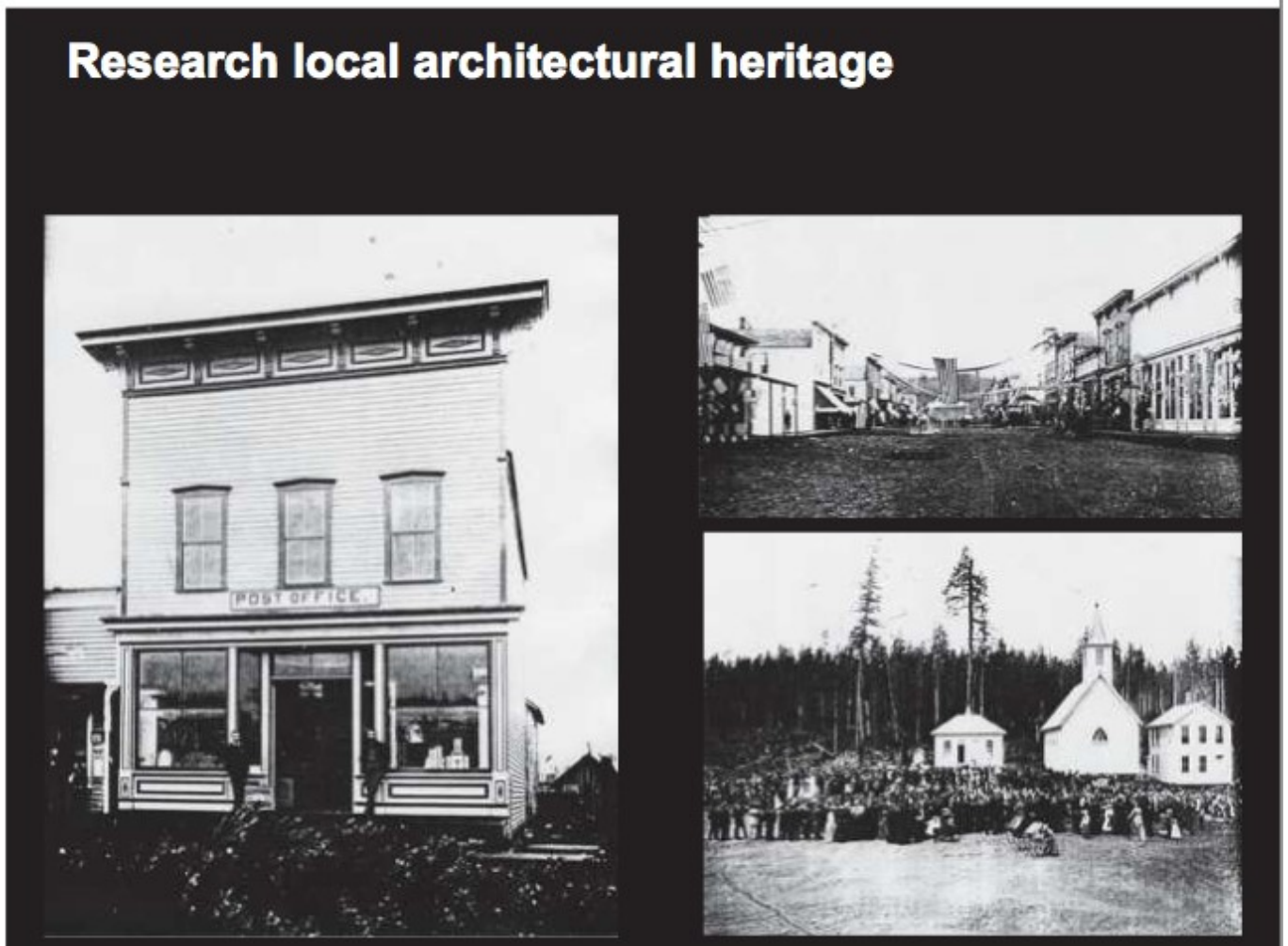
Figure 2. Photographies projetées de villes historiques de la côte de l'Oregon.

La séance permet à l'architecte-urbaniste de présenter les premières intentions du projet. On remarque que chacune des idées est annoncée, appuyée, renforcée, explicitée par le biais d'une référence, que ce soit dans un souci pédagogique ou d'autopromotion. Les mots précédés de « # » renvoient à des objets de provenances et d'usages divers. Les références sont de différentes origines : certaines sont locales, c'est le cas de Coast Road et de la contre-allée de Nelscott, d'autres sont nationales (West Lin, Berkeley et Washington), voire internationales, comme Paris et les Champs-Élysées. Par ailleurs, l'architecte cherchant à rendre son projet indiscutable, les références participent de la rhétorique de plusieurs façons, certaines servant d'exemples (West Lin Berkeley, Washington et Paris), d'autres d'illustrations, comme la contre-allée de Nelscott ou Coast Road.